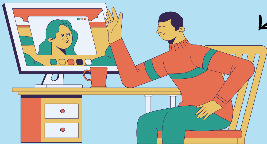
Ответственный за работу с участниками