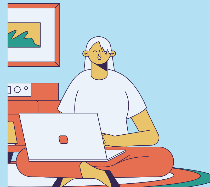
Специалист по SMM (ведение соц.сетей Клуба)